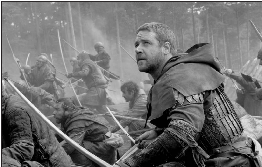
Milyen irányból érkezet közössége és sikere a legújabb Robin Hood-filmek? Hamarosan kiderül