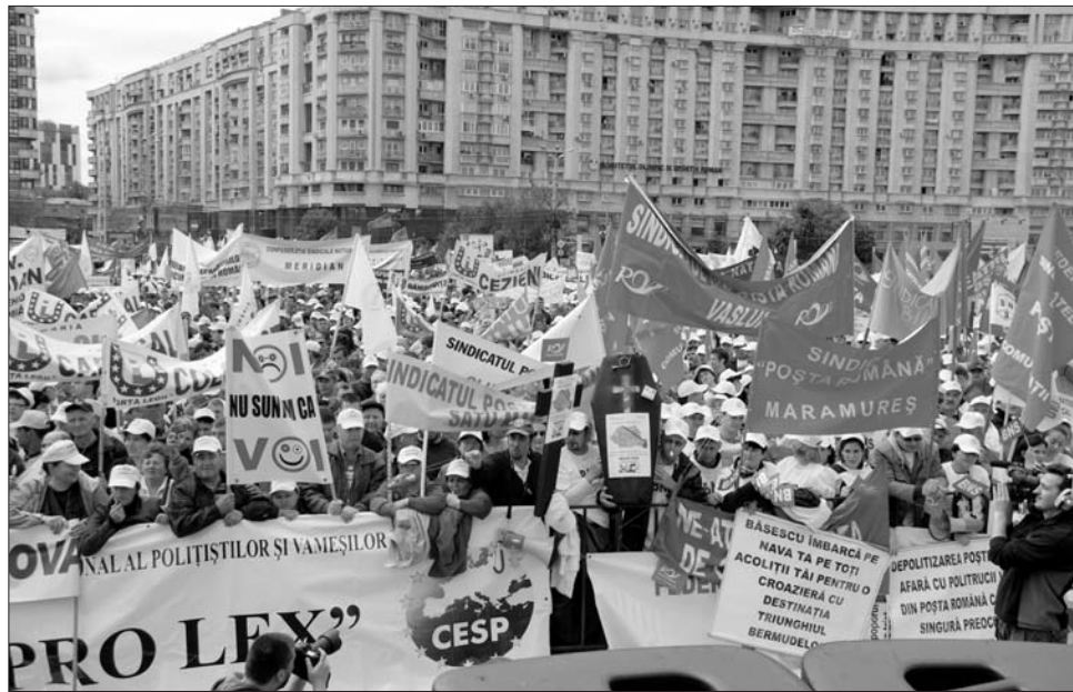
Ették-e a szakszervezetek a mérgezett almából?